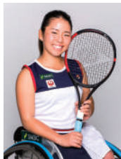
上地 結衣 選手 車いすテニス パリ2024パラリンピック金メダリスト