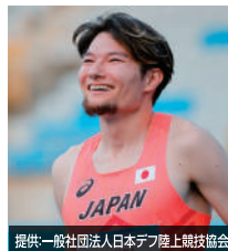
山田 真樹 選手 デフ陸上 サムスン2017デフリンピック金メダリスト