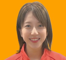
亀澤 理穂 選手 東京2025デフリンピック 卓球女子 日本代表