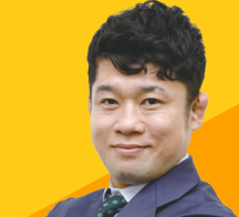
平岡 拓晃氏 スペシャルオリンピックス日本理事長 ロンドン2012オリンピック 柔道男子60kg級 銀メダリスト